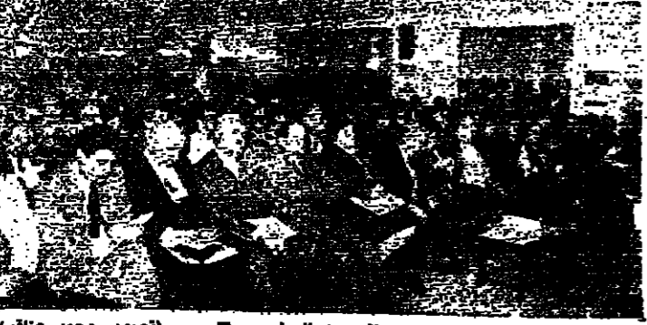
الاجتماعات التي جرت في دمشق